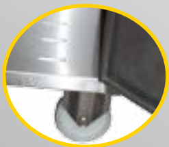
OPTION : ARMOIRE SUR ROUES