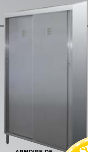
ARMOIRE DE RANGEMENT À PORTES COULISSANTES.

Les armoires sont toutes réalisées en tôle INOX AISI 304L épaisseur 1,2 mm, soudées et robustes. Elles sont équipées de pieds réglables en hauteur, d'un toit en pente pour améliorer l'hygiène et éviter la rétention d'eau et la dépose d'objets. Avec ouïes d'aération sur les portes et dans le bas de l'armoire. Portes verrouillables (serrures fournies).