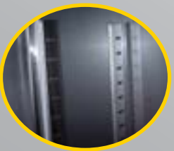
DETAIL : REGLAGE DES PLATEAUX