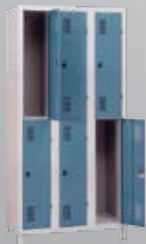
Vestiaires "industrie propre"