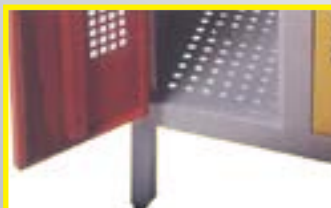
Vestiaires métalliques avec pieds et fond perforé en inox.